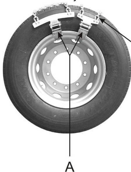
Obrázok 1. Vonkajšia strana kolesa